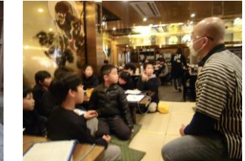
参道・店の賑わいを知る