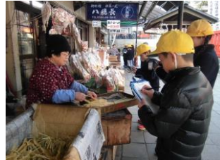
供物の油揚げを扱う人にインタビュー