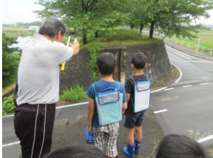
輪中堤の役割を聞く

低学年の地域探検から高学年の郷土の地理に至るまで段階に応じて、実際に現地を訪れて実物を見たり、地域の方々等にも詳細な話を聞いたりしながらの学習により、子どもたちは「体感」していきます。