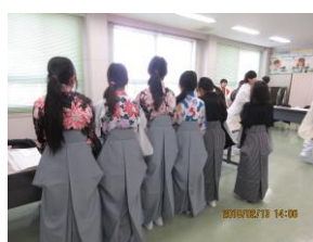
補助金で購入した袴