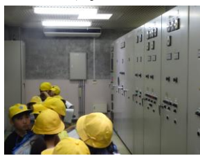
水道の水源のしくみを知る