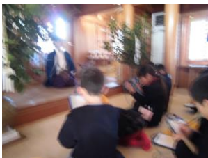
千代保稲荷で宮司さんに話を聞く

水害の多いこの地にあって、500年以上の昔から人々を見守り心の支えとなってきた神社と、その恩恵を受けて栄えてきた周辺に暮らす人々の思いに触れることができました。