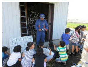
水防倉庫の役割を知る