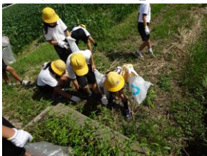
機会をとらえて清掃活動

人々の命や財産を脅かす水は、同時に恵みをもたらす貴重なものであることを知り、その保全をめざす活動にも意識を向けています。