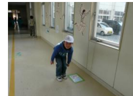
〈幅跳びのフォーム・・・それっ!〉