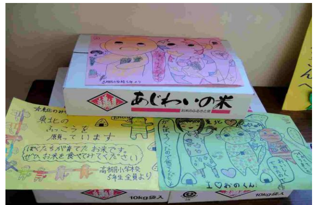
【5年生からの米の贈り物】