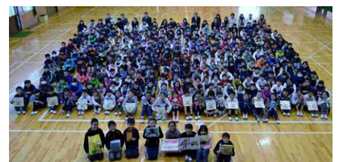
【12月8日おのくん集会での全体写真】