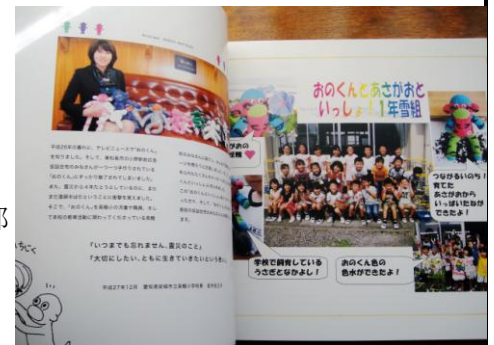
【メッセージ集「おのくんといっしょ」】