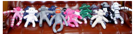
【ソックモンキー「おのくん」】