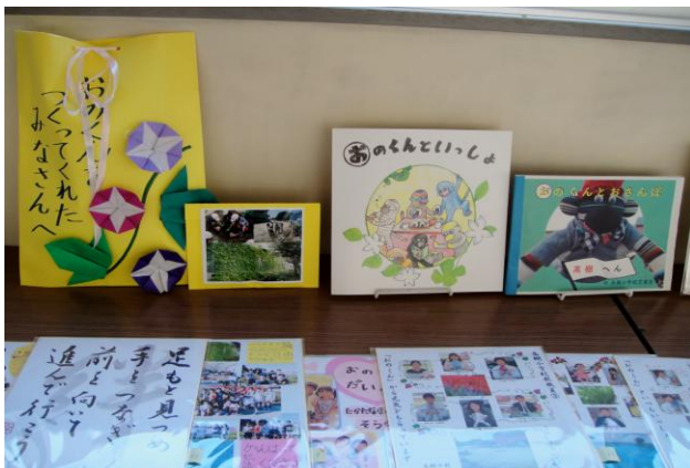
【色紙、メッセージ集などの贈り物】