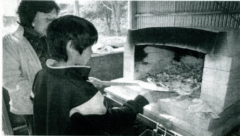
完成したピザ窯でピザを焼く西箕輪中学校中組の生徒ら

伊那市西箕輪中学校の特別支援学級・中組の生徒6人が、市の食農体験事業「暮らしのなかの食」の一環で、同校の中庭にピザ窯を製作した。生徒が育てた野菜を調理し味わう機会を増やすとともに、地域との交流を深めるのが狙い。24日にピザの試食会を開き、交流スペースとして整備された中庭で、地元住民らと焼きたてのピザを楽しみ、親睦を深めた。(飯原麻理子)